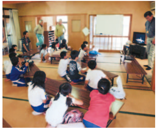
▲事前に田んぼの話聞きDVDを観賞

最初は畦畔で怖がっていた子どもたちも観察するうちに徐々に慣れ、最後はみんなで田んぼに入り大はしゃぎ。カエルやクモ、アメンボなどを捕まえた子どもたちは、田んぼの中に想像以上に数多くの生物が棲んでいることに驚いた様子でした。