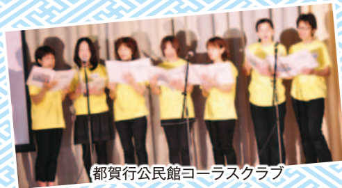
都賀行公民館コーラスクラブ