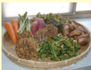
こごみやたららの芽、雪のしたなどの山菜の天ぷら