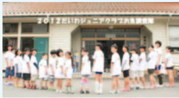
▲▼お魚調査隊のメンバー♪