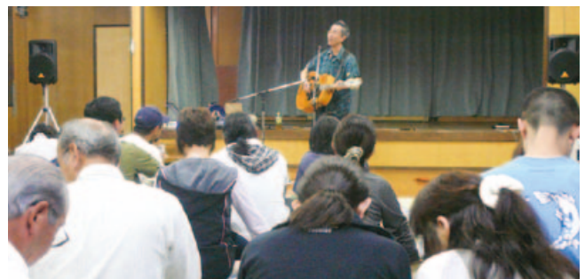
▲トークに耳を傾ける来場者