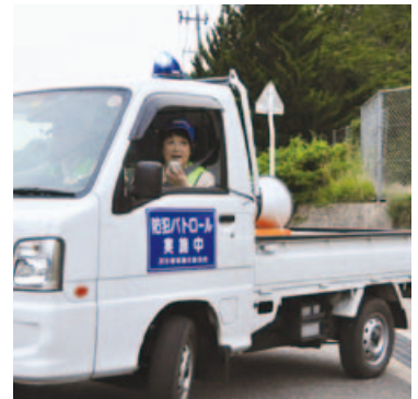
▲「こちらは青色防犯パトロール隊です！」