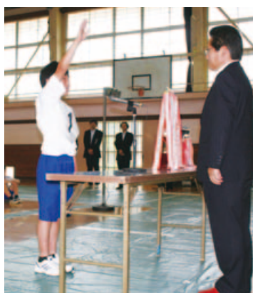
▲選手宣誓をする大和小キャプテン