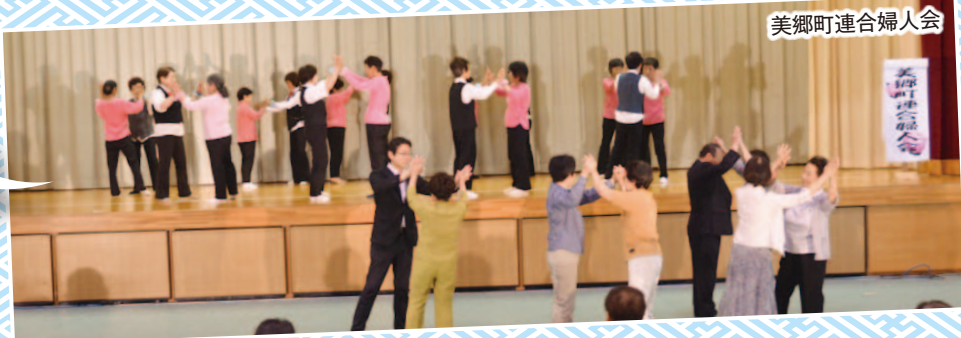
美郷町連合婦人会