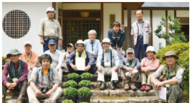
▲ウォークに参加された皆さん