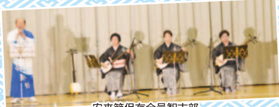
安来節保存会邑智支部