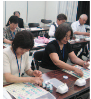
▲1～100までコインを並べるのにどのくらいの時間がかかるかな??