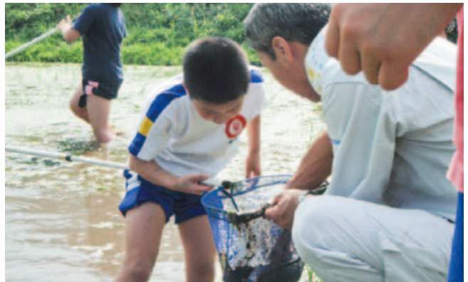
▲「なにがおるかなあ～?」