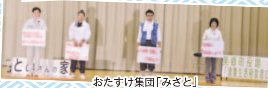
おたすけ集団「みさと」