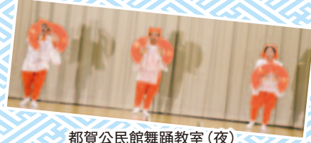
都賀公民館舞踊教室(夜)