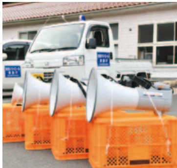
▲コンテナに拡声器を括り付けて軽トラの荷台へ載せる