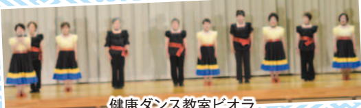
健康ダンス教室ピオラ