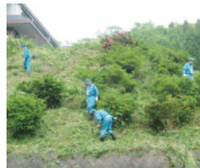
▲中国電力邑智電力センターのみなさん、ありがとうございました!