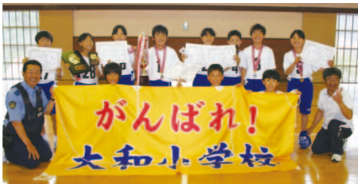
▲邑智郡大会で優勝・準優勝した大和小学校チーム

結果は、団体の部で大和小Aチームが優勝、大和小Bチームが準優勝と29連覇達成!!また、個人の部では、1位から5位まで大和小児童が独占しました!大和小Aチームは7月13日(金)に出雲市で開催される県大会へ出場されます。おめでとうございます!