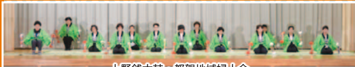
上野銭太鼓・都賀地域婦人会