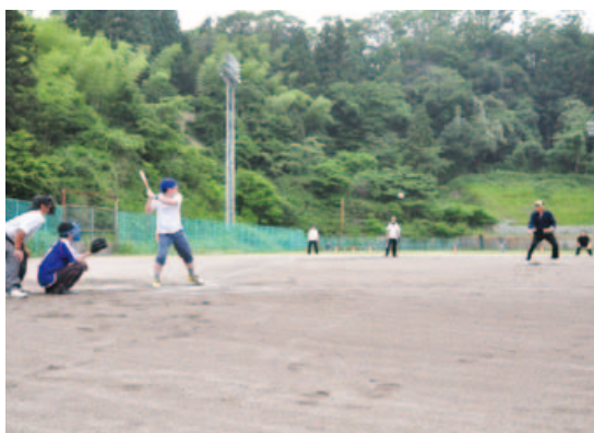
▲現役ピッチャー?!力強い投球!

開幕前には、中国電力邑智電力センターの職員のみなさんが、社会貢献活動としてふれあい広場周辺の草刈りをしてくださいました。本当にありがとうございました。