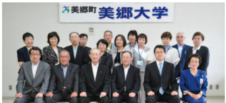
▲美郷大学の新入生のみなさん(2列目以降)