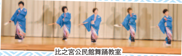
比之宮公民館舞踊教室