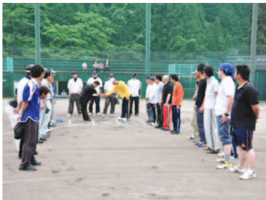
▲いよいよ、開幕戦のはじまりです!

6月11日(月)に、今年で8回目となる『美郷町民ふれあいソフトボール大会』が開幕しました。約1ヶ月にわたり、地域の部21チーム、女子の部3チーム、計24チームによる熱戦が繰り広げられます。