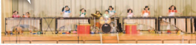
広島ジュニアマリンバアンサンブル