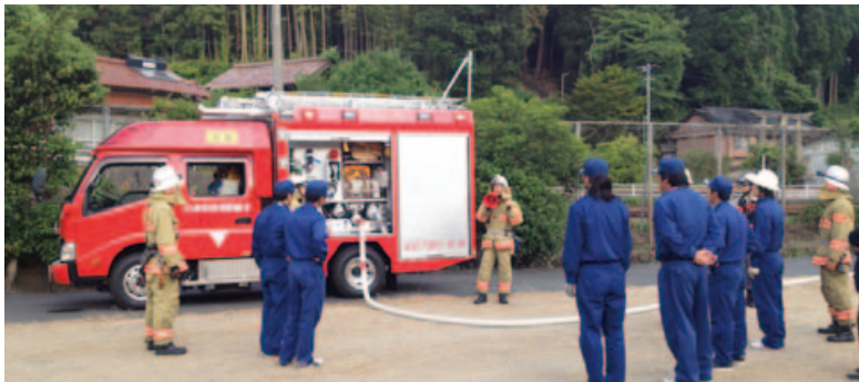
▲CAFSを搭載した消防車