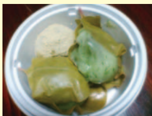
まき、草餅、うぐいす餅