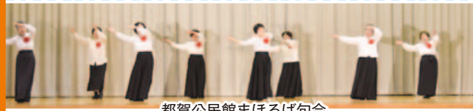
都賀公民館まほろば句会