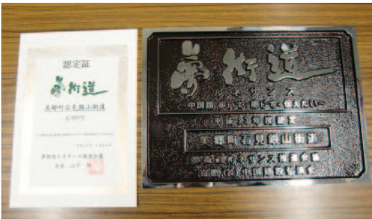
▲夢街道の認定証と約7kgの重さの銘板

6月24日(日)に、「美郷町石見銀山街道振興協議会」主催の銀山街道ウォークが行われ町内外から11名が参加されました。天候にも恵まれ、約6kmのコースをガイドのお話を聞きながら歩きました。別府から銀山街道に入り山々の景色や山野草の観察をしながら歩き、湯抱では11基の歌碑めぐりや鴨山公園から鴨山を望み、自然や歴史にふれた1日となりました。