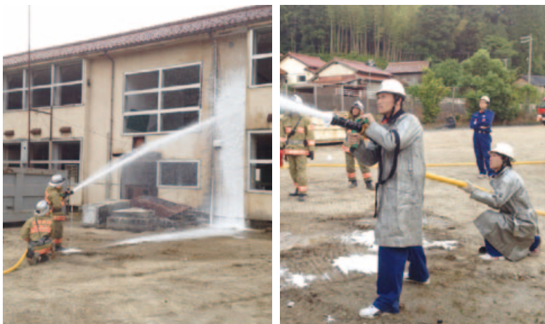
▲訓練を行う自動車分団員と邑智出張所職員

6月7日(木)に、旧浜原小学校グラウンドで、美郷町消防団自動車分団と江津邑智消防組合邑智出張所職員合同の火災想定訓練が行われました。