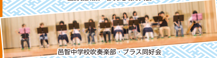
邑智中学校吹奏楽部・プラス同好会