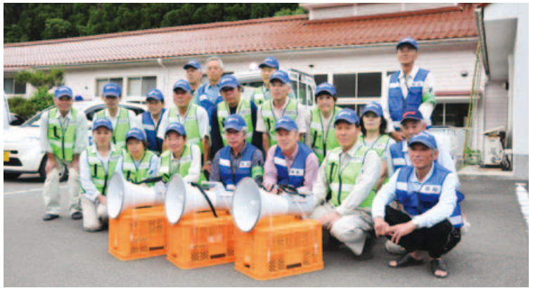
▲防犯パトロール隊のみなさん

この日は、防犯パトロールのベストに帽子を着用した21名の隊員が青色回転灯を設置した自家用車に乗って、沢谷交流センターに集合。拡声器をコンテナに括り、軽トラの荷台に設置するというユニークな発想で、助手席の隊員が、「振り込め詐欺や悪質訪問販売には気をつけましょう」と呼びかけながら、地域内を4つのコースに分かれてパトロールを行いました。