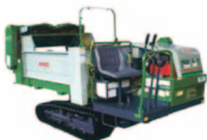
☆自走式堆肥積込・散布機