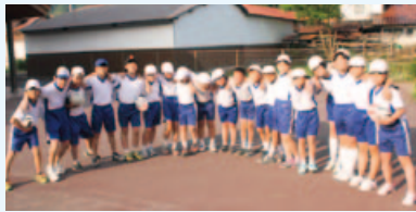
▲▼タグラグビーのメンバー♪

タグラグビーのルールは一般的なラグビーと共通していますが、接触プレーのない小学生でも安心してできるスポーツです。練習は、毎週水曜日の放課後に大和小学校のグラウンドで1時間半の短い時間ですが、スクールバスでの帰宅ができる範囲内で練習を行っています。練習時間は少ないものの、今年度も県大会を突破して、中国大会での優勝と全国大会への出場を目指して、練習に励んでいます。