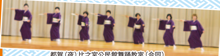
都賀(夜)比之宮公民館舞踊教室(合同)