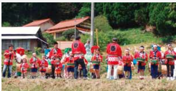
▲田植えを盛り上げる楽打ち