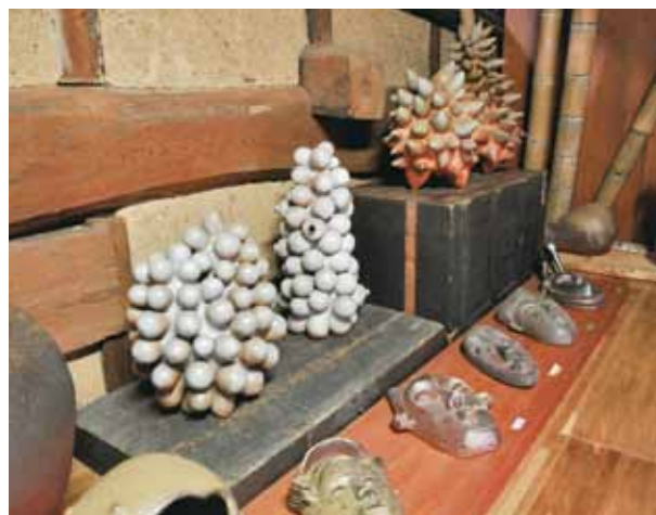
▲ギャラリーに展示された作品の数々