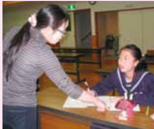
▲▼理解するまで質問します

現在、邑智教室は35人、大和教室は16人が申し込んでいます。申し込みは今後も随時受け付けています。