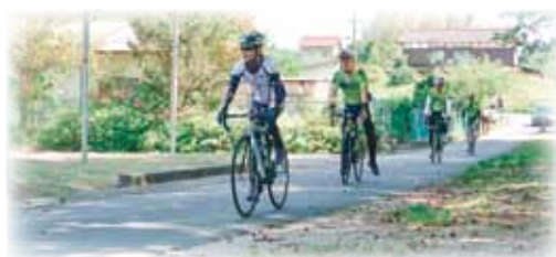
▲エイドステーションにGO！

美郷町にはカヌーの里おおちにエイドステーションが設けられ、選手は用意された水分と軽食を補給していました。参加人数は約570名(県外約400名)で美郷町からも数名エントリーされていました。参加された方は「しんどかったけど、天気が良くて楽しく走り終えることができた！」と汗をキュッと拭き取られました。