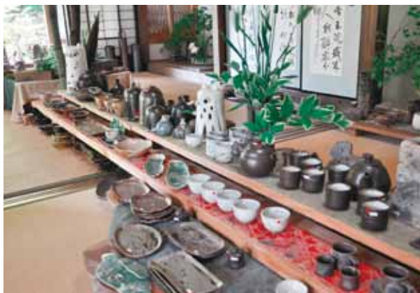
▲ずらっと並んだ陶芸品