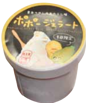
▲ポポージェラート