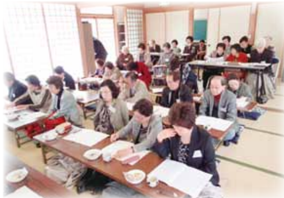
▲講評を聞く参加者