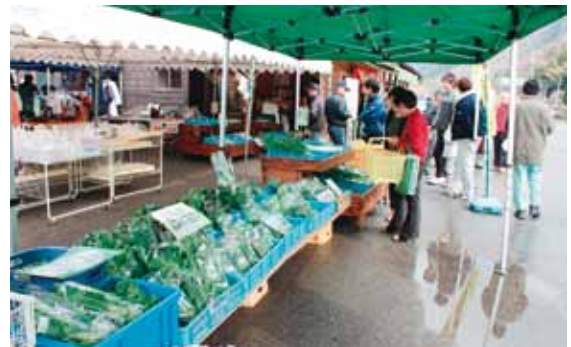
まほろば産直市春まつりの様子

この取り組みの中で必要とされるのは大まかに分けて、生産、加工、販売、宣伝の4つです。その4つを「農業振興部門」、「加工部門」、「産直部門」、「企画部門」とし、都賀・長藤に配属されている4人の協力隊員がひとりずつ担当しています。今年は大きな節目となりますが、是非、頑張っていけたらと思っています。