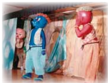
▲躍動感のある演劇

劇は『劇団バク』による「やさしい赤鬼と青鬼」という演目でした。劇の前には『劇団バク』のお姉さんと一緒にみんなの手遊び「げんこつ山のためきさん」をしました。が、うねんねしての部分でお姉さんが寝てしまい、子どもたちが「寝とるよー！」と突っ込む場面も…。 マスクプレイ・オペレッタと呼ばれるこの人形劇ですが、表情が変わらないはずの人形からはおもしろいほど感情が伝わってきて、子どもたちは真剣に見入っていました。