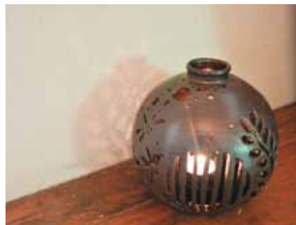
▲優しい光を通す灯り取り

陶芸まつりの期間中、足を運んでくれたお客さんに「器を見てもらいたい」と日替わりで軽食のおもてなし。盛り付けも上品で「和」の心を感じました。