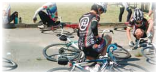
▲休憩中は自分も愛車もメンテナンス