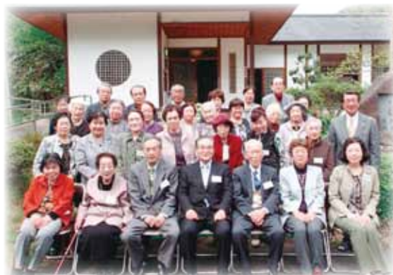
▲みんなで記念撮影