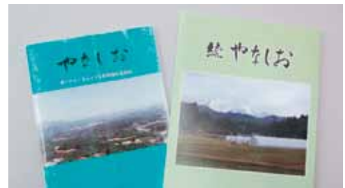
平成5年に発刊された「やなしお」と今回発刊された「続やなしお」

地域の120戸に配布されたほか、町教育委員会や邑智小中学校、図書センターにも寄贈されました。