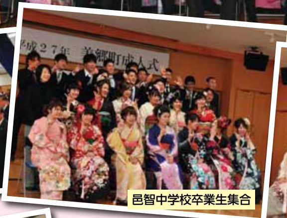
邑智中学校卒業生集合