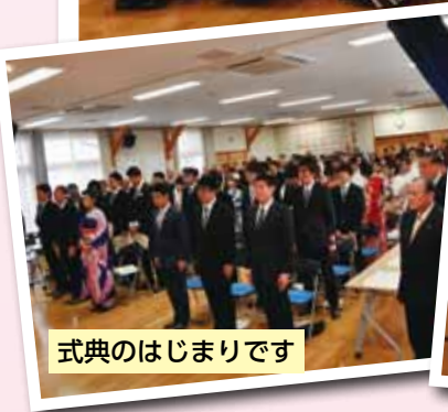
式典のはじまりです