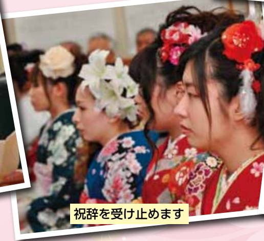
祝辞を受け止めます