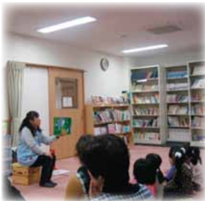
▲託児の子どもも人権紙芝居を聴いています