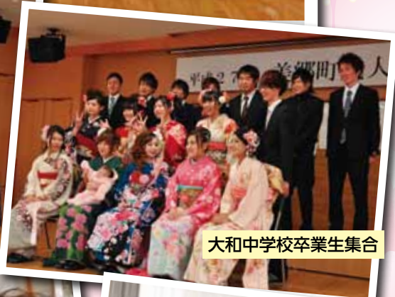
大和中学校卒業生集合