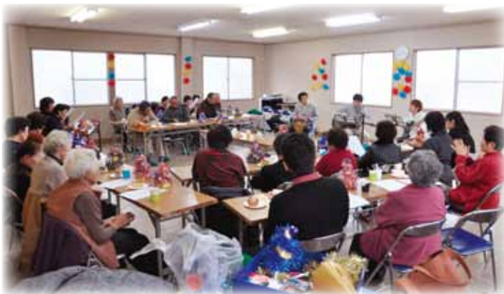
▲みんな一緒に歌いました♪

参加者には歌詞カードが配られ、「きよしこのよる」や「花は咲く」などを合唱し、やさしい気持ちになりました。