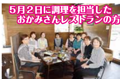
5月2日に調理を担当した おかみさんレストランの方々