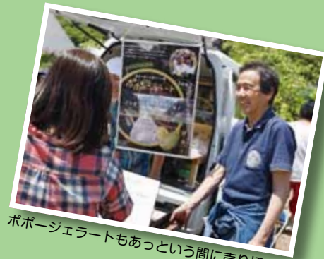
ポポージェラートもあっという間に売り切れ!