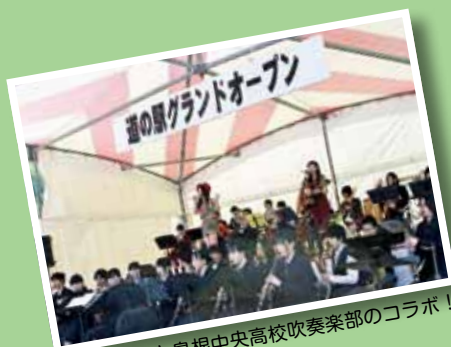
kotonohaと島根中央高校吹奏楽部のコラボ!