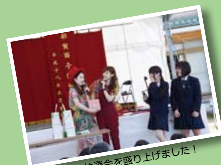
一緒に抽選会を盛り上げました！