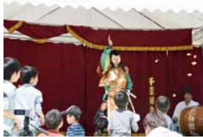
◀恵比寿さんの大盤振る舞いに大人も子どもも大喜び！