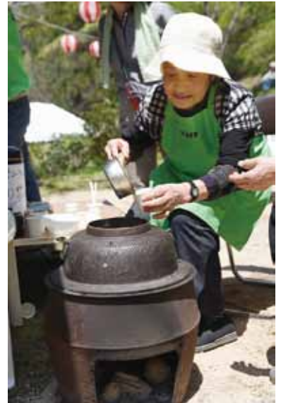
▲歴史を感じるこの茶釜。中には美郷の薬草茶。このお茶飲んだら疲れもとれるでえ〜。