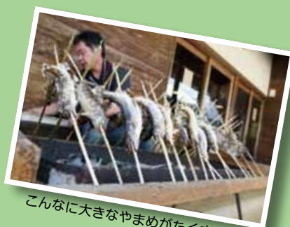
こんなに大きなやまめがたくさん！