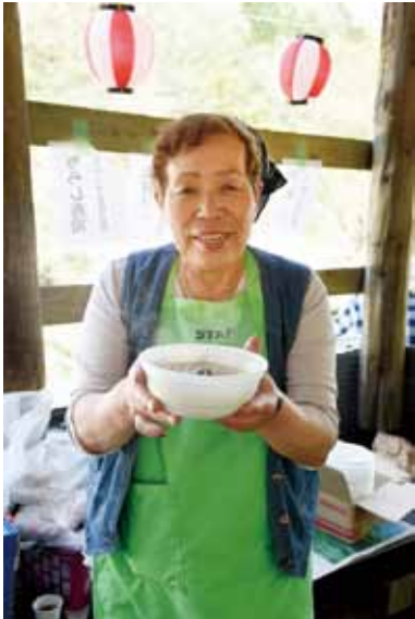
▲食べてみんさい！具だくさんの山賊鍋！私が作ったんよぉ〜♪