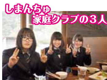
しまんちゅ 家庭クラブの3人

お かみさんレストランは都賀長藤地域の婦人会が結成したグループで、2つのグループがあります。第1土曜日と第3土曜日に料理を提供します。家族だけでなく地域の方が協力してくださって、とてもやりがいを感じます。