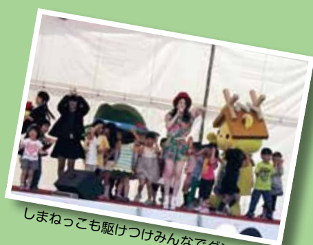
しまねっこも駆けつけみんなでダンス!