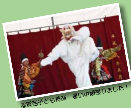
都賀西子ども神楽 暑い中頑張りました！