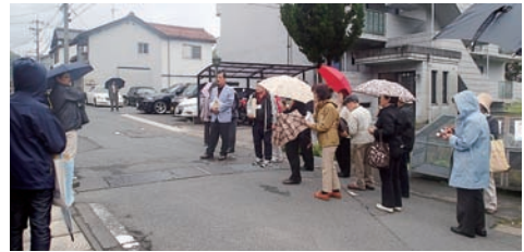
▲まちあるきの様子