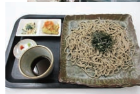
▲いちごのお店と大人気メニューのざるそば

その中で調理、接客などを支援して商店街を中心に美郷の方々や美郷を訪れた方々と交流させて頂いております。