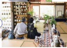
▲ずらりと並ぶ作品の数、約300点