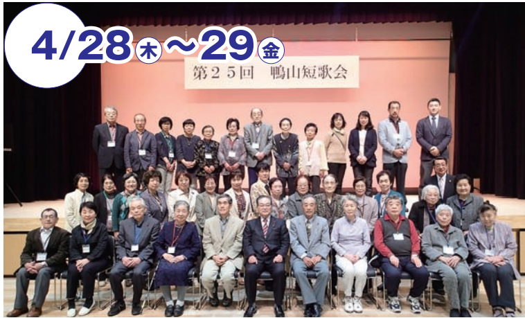
▲参加者全員で記念撮影。2日間で交流が生まれました