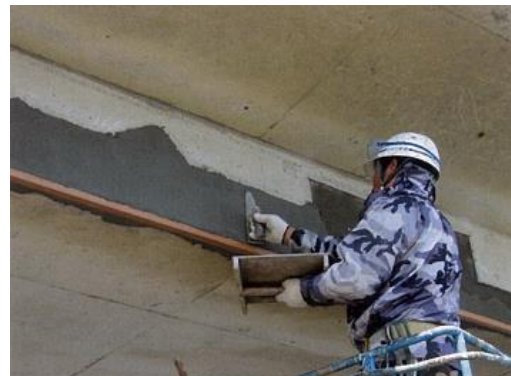
写真3 断面修復状況