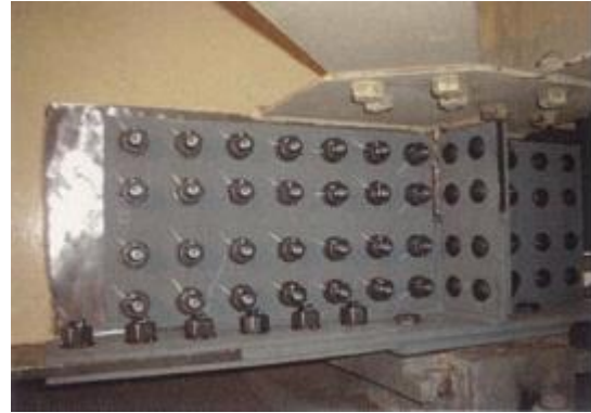
写真1 当て板工実施状況