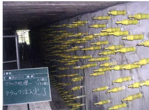
写真2 ひび割れ注入状況

ひび割れを塞ぐことにより、劣化因子（水分、塩化物など）の侵入を防止し、コンクリートの耐久性を向上することができます。