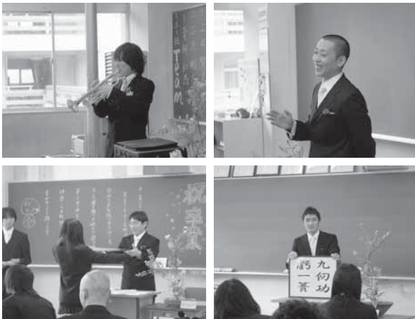
式後のホームルームより

3月1日(月)、島根中央高校第1期生97名の卒業証書授与式が行われました。本校は、平成19年4月1日に川本、邑智両高校が統合され新しく島根中央高校として発足しました。それから3年が経ち、川本、邑智両校の伝統を引き継いで、立派な生徒に成長してくれました。 その間地域の皆様には大変お世話になりました。ありがとうございました。今後とも御支援をよろしくお願いいたします。