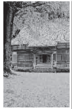
最優秀賞作品 「黄色いジュウタン」