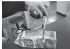
電気パンを作りました！

電気エネルギーが熱エネルギーに変換されて仕事をすることを学ぶ実験で電気パンを作りました。