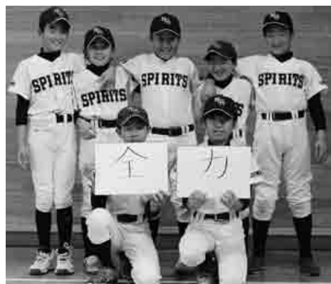
①川本中央スピリッツ (小5) ②どんな状況でも全力で行動・プレーする ③全国大会出場 ④少年野球用のスタジアムが完成。私たちの中からプロ野球選手が誕生している