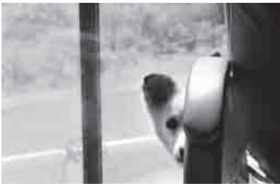
写真展奨励賞「じー」